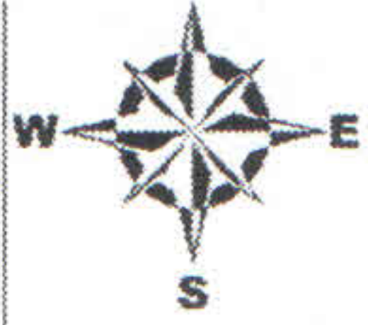
СХЕМА ГРАНИЦ РЫБОВОДНОГО УЧАСТКА