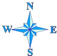
СХЕМА ВОДНОГО ОБЪЕКТА